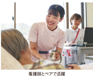
看護師とペアで活躍

「根拠のある介護」とはどのようなものなのでしょうか。介護福祉士はそれぞれの利用者さんの異なるニーズに応じて、その人らしい生活ができるように支援する役割を担っています。例えば、脳梗塞により片麻痺などの後遺症が残っても、生活歴、価値観などが違えば介護の方法は変わってきます。なぜそのような介護をするのかを説明できるのが「根拠のある介護」です。このことは体位を変えるときや、福祉用具を活用して環境を整えることにも言えることです。また、利用者さんの生活を支える介護福祉士は、その人のこの状態や身体機能の変化に気づくことが多くあります。「いつも違う」ことに気づくことは根拠のある介護につながります。それが分かるための細やかな観察力には、「医療の知識」が必要となるのです。