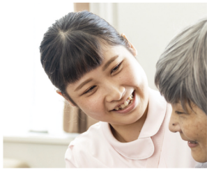
想いをくみ取り寄り添う

「その人らしさ」は人それぞれですが、これまでの人生で大切にしてきた生活習慣を生かした介護が重要と捉えています。その時々、想いをくみ取り、その人の思い描く生活に近づけるよう、人生に寄り添うのです。