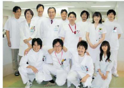
医局員、研究補助員ならびにローテート中の研修医とともに

泌尿器科では本年度3名の新入医局員を迎え、スタッフが10名となりました。昨年は川崎医大で初の女性泌尿器科医が誕生していま