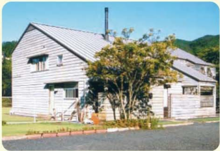
関金セミナーハウス

浴室は、良質の温泉(白金の湯・関金温泉)として親しまれており、放射能泉、単純泉のラジウム温泉(ラジウム含有量世界有数)で神経痛、リュウマチのほか痛風、疲労回復に特効とされています。自然探訪やスキー場、海水浴への拠点として、蒜山や大山、日本海へ足を延ばすにもかかわらず、今でも、多くの教職員や、学生たちが利用しています。