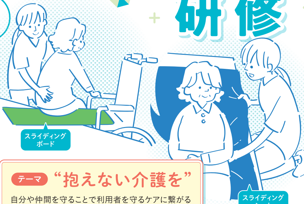
スライディング ボード