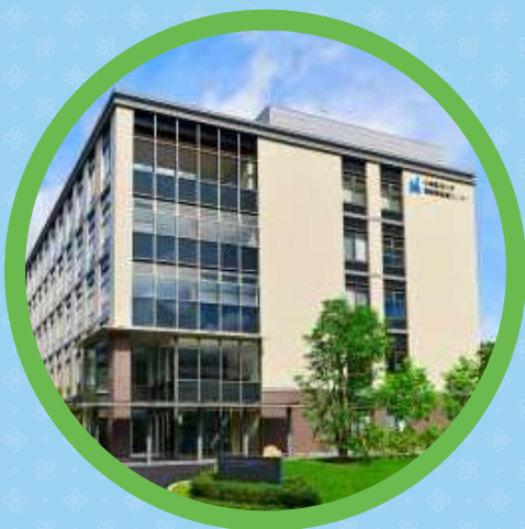
川崎医科大学 高齢者医療センター