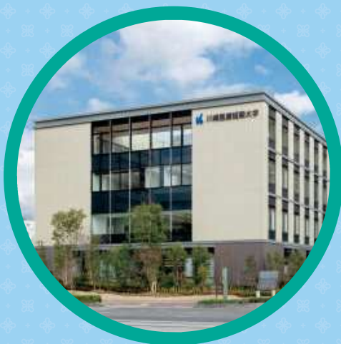
川崎医療短期大学 総合受付