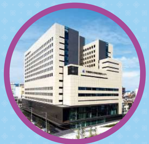
川崎医科大学 総合医療センター