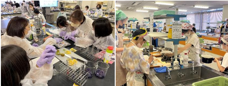
昨年度開催の様子