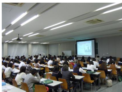
小論文に関するアドバイス